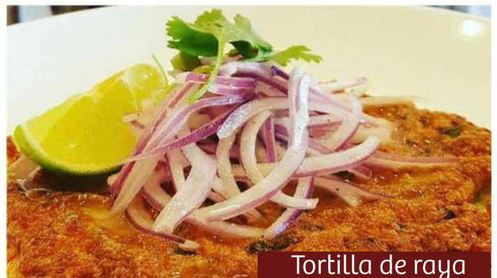
Tortilla de raya