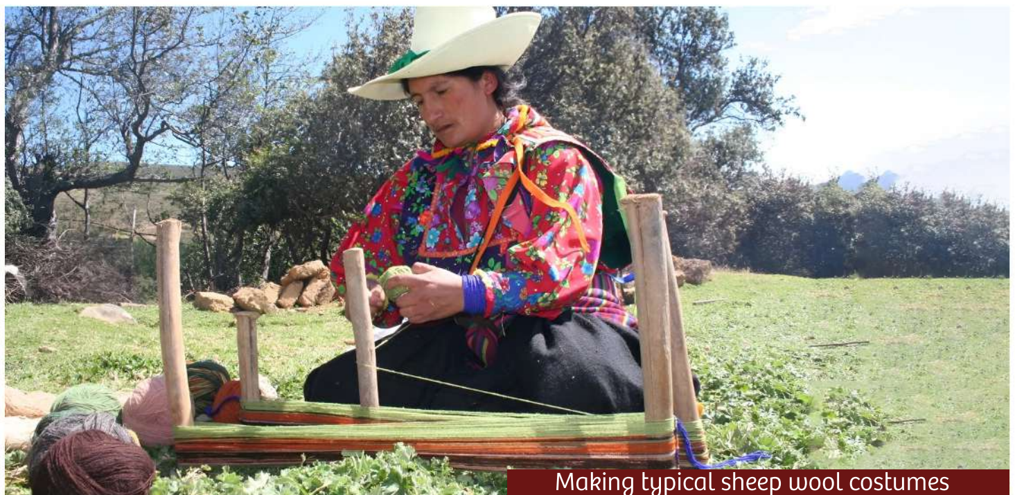
Making typical sheep wool costumes