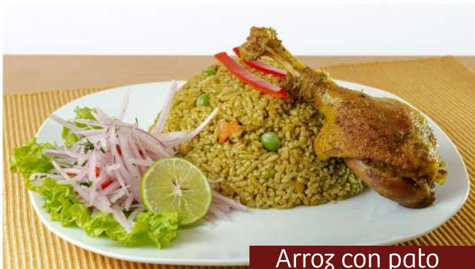
Arroz con pato