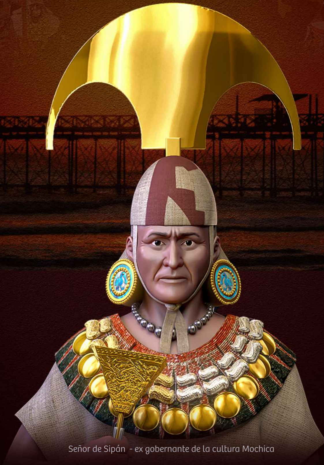
Señor de Sipán - ex gobernante de la cultura Mochica